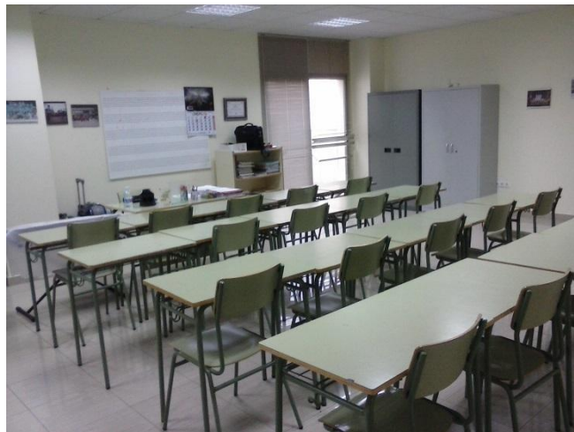
Aula de 7 Anys Preparatori