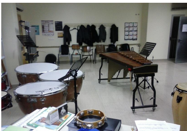
Aula de Percussió