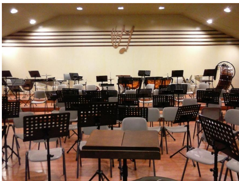
Auditori Conjunt Instrumental