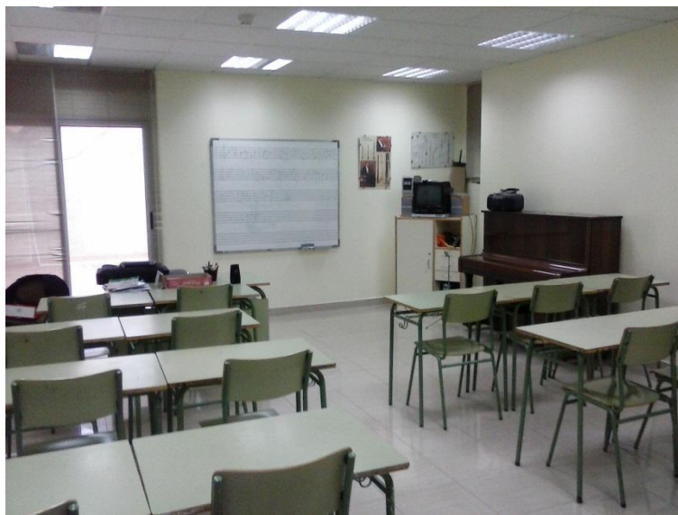
Aula 1r- 2n Llenguatge Musical