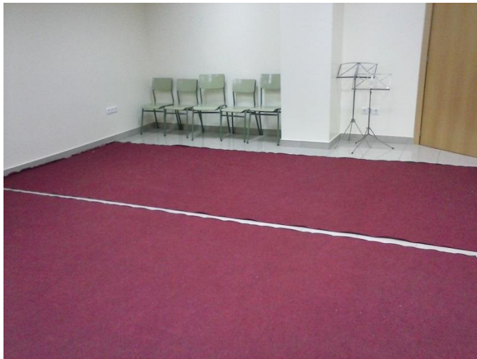
Aula de 1 Any a 4 Anys