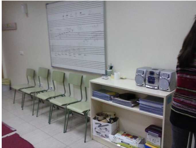
Aula de 5 Anys a 6 Anys