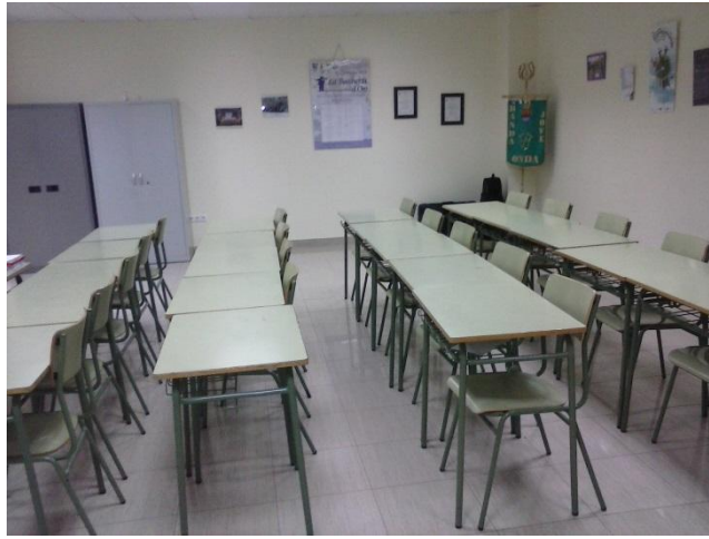
Aula Formació d'adults